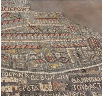
Mosaikken i Madaba