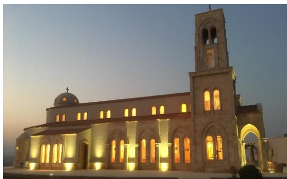
Lutherske kirken ved Jordanelven